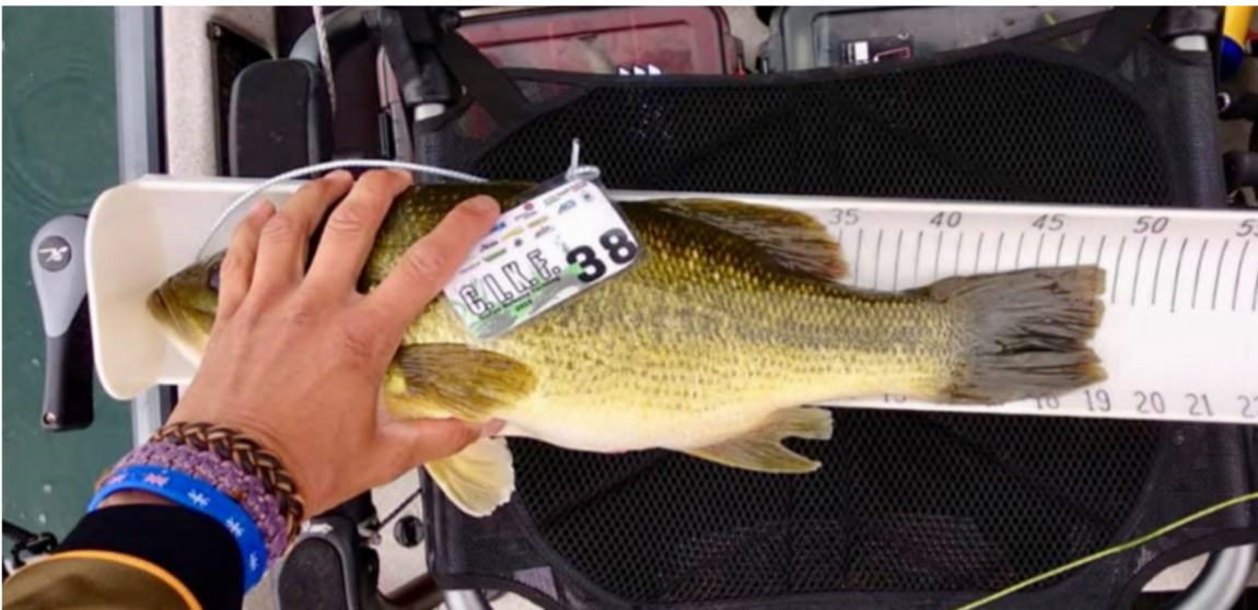
Foto misurazione corretta

Non coprite gli occhi e le pinne anali e caudali.