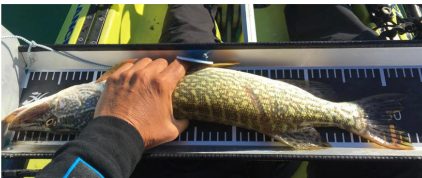
Pesce posizionato al contrario e il tag non visibile = punteggio 0